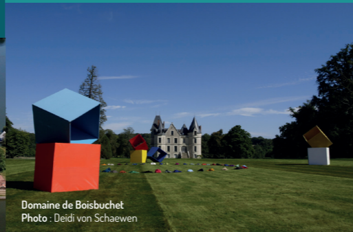
Domaine de Boisbuchet

Un manoir du 19ème siècle et un parc paysager, situés au bord de la Vienne, construisent le cœur des 150 hectares de forêts, de prairies et d'eaux du Domaine. Alexander von Vegesack, directeur fondateur du Vitra Design Museum en Allemagne, a dédié ce lieu à la recherche en design et en architecture avec un programme d'ateliers et d'expositions changeant chaque année, ces dernières étant souvent basées sur la collection unique de design de Boisbuchet. Répartis sur le site, une vingtaine de bâtiments offrent des exemples remarquables d'architecture innovante.