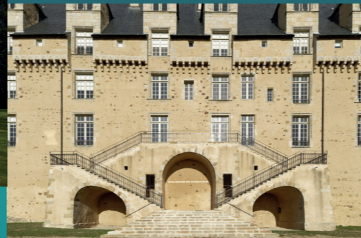
Dora García, Nous sommes des extraterrestres , 2017 Collection Château de Rochechouart.

Inauguré en 1985 par le département de la Haute-Vienne, au sein du prestigieux château de Rochechouart, le musée d'art contemporain de la Haute-Vienne a constitué en 30 ans une collection remarquable qui compte aujourd'hui plus de 800 œuvres d'artistes internationaux depuis les mouvements du Land Art et de l'Arte Povera à la scène la plus actuelle ainsi qu'un ensemble de commandes dialoguant avec le lieu patrimonial. Le musée possède par ailleurs le plus important fonds, en France, de l'artiste dadaïste Raoul Hausmann (1886 - 1971). Le château de Rochechouart est un service du département de la Haute-Vienne. Il est labellisé Musée de France.