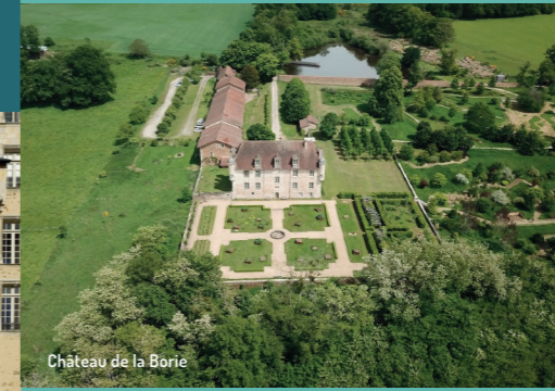
Château de la Borie

Le Château de La Borie est situé au milieu des collines du Limousin, dans le village médiéval de Solignac, à 5 kilomètres au sud de Limoges. Le château abrite la galerie La Borie qui présente des artistes contemporains internationaux, en mettant l'accent sur la jeune génération. Autour du château se trouvent plusieurs jardins écologiques : le jardin contemporain, "Le Jardin en mouvement" inspirée des idées du paysagiste français Gilles Clément, un potager en permaculture et un jardin à la française.