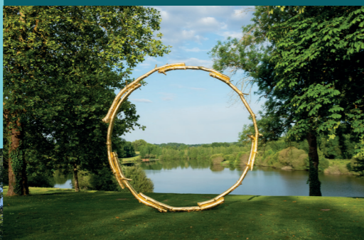
Ugo Rondinone, The Sun , 2017

Le restaurant Dyades +33 5 45 61 85 05 restaurant@domainedesetangs.com