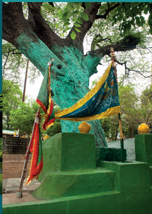
Exposition 2022 : Arbres sacrés de l'Inde

Tarifs exposition (env. 45 min) : 8 / 4 €, groupes ≥ 6 : 5 €, < 12 ans gratuit