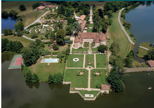
Domaine des Étangs

Le Domaine des Étangs s'étend sur 1 000 hectares de nature préservée, partagée entre forêts, pâturages et étangs. Depuis 2014, la Collection Garance Primat s'épanouit dans cet espace où l'art est partout : dans le château du XIIIe siècle et ses maisons de métayers, dans le parc de sculptures qui se développe en plein cœur de la nature, ainsi que dans une ancienne laiterie devenue espace d'art. La collection y organise chaque année une exposition qui illustre le lien étroit qui existe entre la nature, l'art et la science. Le Domaine des Étangs abrite également une ferme, un potager en permaculture, un hôtel 5 étoiles, un restaurant et un espace de bien-être.