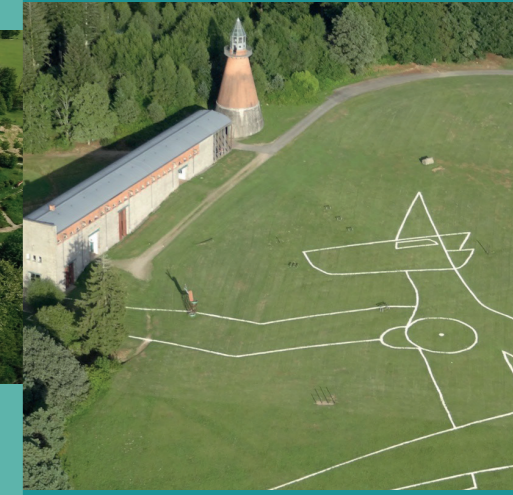
Yona Friedman, La Licorne Eiffel , CIAP Vassivière 2009

Le Centre International d'Art et du Paysage de l'Île de Vassivière (CIAPV), en Nouvelle-Aquitaine, appuie la recherche, l'expérimentation, la production et la diffusion de l'art contemporain. Unique dans le paysage artistique français, le CIAPV est connu pour son architecture contemporaine remarquable conçue par Aldo Rossi et Xavier Fabre, sa collection permanente en plein air, et son programme d'expositions, résidences, éditions et événements explorant l'art et le paysage.