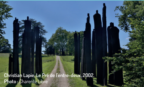
Christian Lapie, Le Pré de l'entre-deux , 2002.

Visite : 11 - 19h sur réservation (env. 1 heure) Tarifs : 4 / 2 € Sans réservation entre le 23 juillet et le 18 septembre.