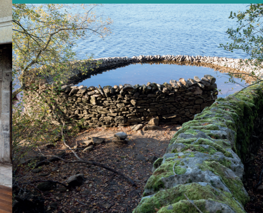
Andy Goldsworthy, Sans titre , 1992.

Le Bois de sculptures Accès libre et gratuit toute l'année