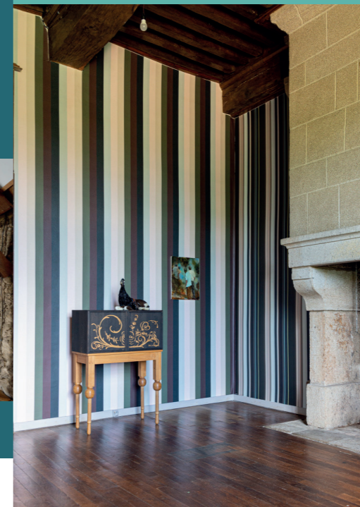
Vue d'installation ÉCRIT SUR LE VENT (with Irma Boom, Thomas Grünfeld, Christien Meindertsma, Christopher Orr), Château de la Borie, 2022.

Visites guidées à 15h et 16h30 Tarifs : 5 / 3 € galerie ou jardin seulement, 8 / 4 € galerie + jardin