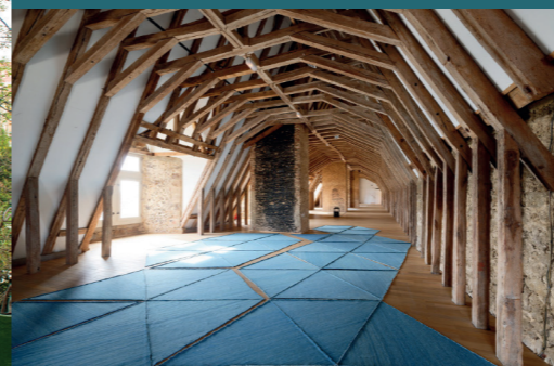
Helen Mirra, Sky Wreck 1/22 , 2001. Crédit de l'artiste et de la galerie Meyer Riegger Karlsruhe / Berlin. Photo : Aurélien Mole

Pour plus d'informations sur les visites guidées, les hôtels et restaurants à proximité, etc., veuillez consulter les sites web des institutions.